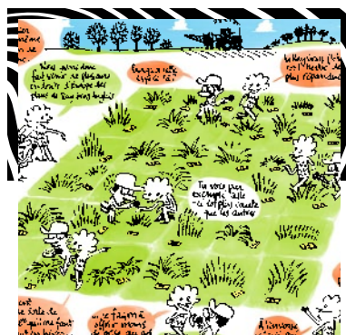
MA THÈSE EN BD

En partenariat avec la maison des auteurs à Angoulême mais aussi avec NACSTI (consortium CCSTI de Nouvelle-Aquitaine), "Ma thèse en BD" est une exposition pédagogique et originale qui valorise et vulgarise des thèses au service de la culture et de l'innovation.