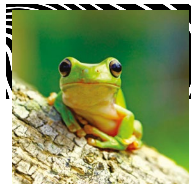
LA NOUVELLE-AQUITAINE, RÉGION "BIO INSPIRÉE"

En partenariat avec la maison des auteurs à Angoulême mais aussi avec NACSTI (consortium CCSTI de Nouvelle-Aquitaine), "Ma thèse en BD" est une exposition pédagogique et originale qui valorise et vulgarise des thèses au service de la culture et de l'innovation.