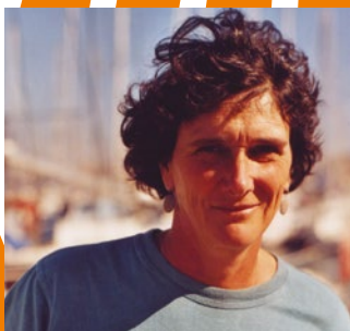
ISABELLE AUTISSIER navigateur et présidente WWF-France

Navigateur française, Isabelle Autissier est la première femme à avoir accompli un tour du monde en 1991. Engagée, elle occupe aujourd’hui le rôle de présidente de WWF-France. Pour NOVAQ, elle interviendra en tant que grand témoin sur la thématique de l’innovation pour une vie meilleure et abordera les sujets tels que l’agroécologie, l’énergie et l’océan.